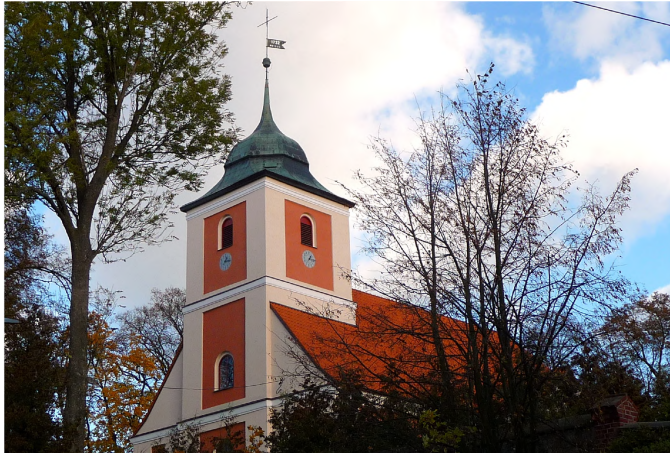
Zdjęcie nr 2. Kościół rzymskokatolicki, parafialny pw. Matki Boskiej Częstochowskiej, ul. Sienkiewicza 3a, Drygały

Pierwszy kościół katolicki zbudowano w 1438 r. Spalony w czasie Potopu w 1656 r. przez Tatarów. Kościół odbudowany przez katolików w 1660 r., rozebrano w 1730 r. W latach 1731 - 1732 zbudowano istniejący kościół.