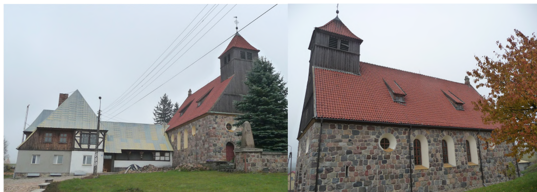
Zdjęcie 4, 5. Kościół rzymskokatolicki, parafialny pw. Chrystusa Króla, Skarżyn

Kościół wzniesiony w latach 1927 - 1929, na miejscu poprzedniego, drewnianego. Po II wojnie światowej przejęty przez katolików. Zespół kościelny usytuowany w centrum wsi, po płn. stronie drogi. Zespół usytuowany jest na obszernej parceli, na wzniesieniu. Kościół połączony łącznikiem z plebanią.