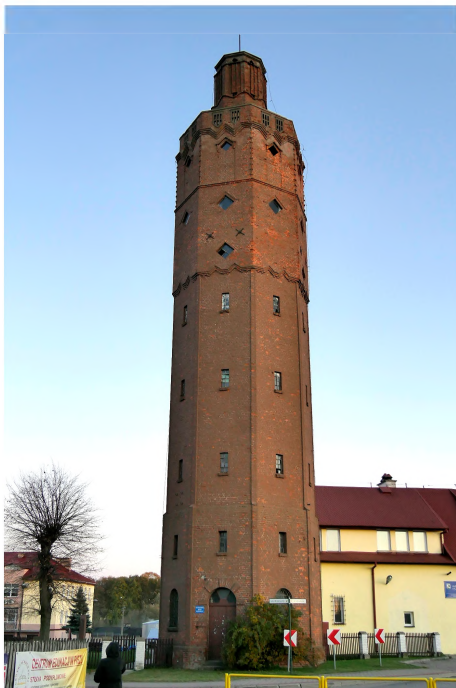
Zdjęcie nr 11. Wieża ciśnień, ul. Ogrodowa 1, Białka Piska