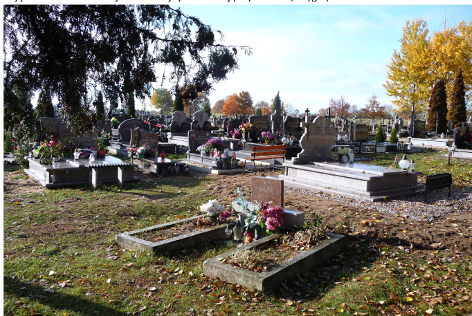
Zdjęcie nr 10. Cmentarz parafialny, Drygaly

Na terenie wschodnich Mazur zlokalizowane są licznie cmentarze z czasów I wojny światowej. Jesienią 1914 r. wojska niemieckie i rosyjskie starły się w wielkiej bitwie nad jeziorami mazurskimi. Strona atakująca byli Niemcy, którzy chcieli zatrzymać Rosjan a potem wyprzeć ich z Prus Wschodnich. W trakcie trwających dwa tygodnie walk zginęło po obu stronach kilkadziesiąt tysięcy żołnierzy. Na terenie gminy Biała Piska znajdują się cmentarze i mogiły: 50 cmentarzy wyznaniowych, dawnych ewangelickich. Stan zachowania cmentarzy jest niezadawalający, większość z nich zatraciła pierwotny układ, są zarosnięte, zaniedbane, nieogrodzone. Trudno do nich trafić, gdyż nie są oznakowane. Obiekty te reprezentują duże wartości krajobrazowe, kulturowe, historyczne, przyrodnicze i zabytkowe. Zdecydowana