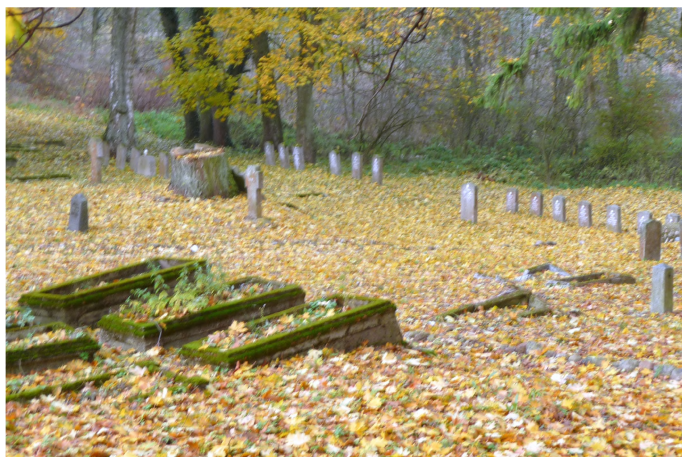
Zdjęcie nr 8. Cmentarz ewangelicki, ul. Sikorskiego, Biała Piska