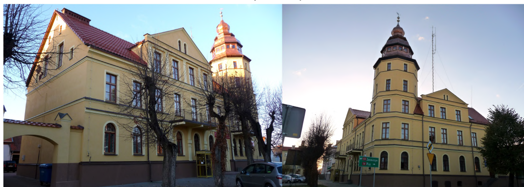
Zdjęcie 6, 7. Ratusz, ul. Plac Mickiewicza 25 w Białej Piskiej