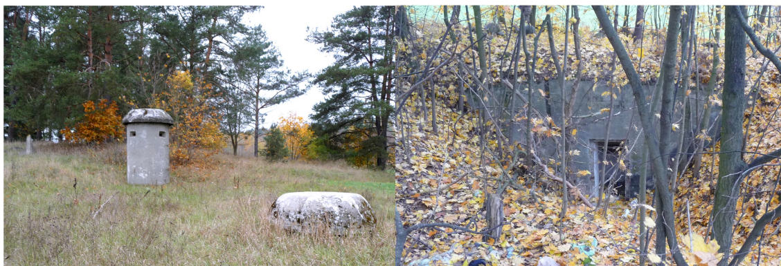
Zdjęcia nr 13, 14. Schrony, Świdry

Na terenie gminy zachowały się obiekty militarne z czasów I wojny światowej. Można odnaleźć liczne pozostałości tzw. garnków Kocha z II wojny światowej, zwany również Kochbunkier - mały schron jednoosobowy. Niezwykle popularny niemiecki schron, jako jedyny był produkowany masowo w fabrykach jako prefabrykat - i jako taki był przywożony gotowy na miejsce posadowienia. Jego rolę na polu bitwy można określić krótko - lepsze to niż zwykły okop, dawał podstawowe schronienie przed ogniem wroga. Kochbunkier nie chronił strzelca przed bezpośrednim uderzeniem pocisku większego kalibru, ale spokojnie opierał się odłamkom. Część Mazurskiej Pozycji Granicznej (Masurische Grenz Stellung) zbudowanej w okolicy wsi Świdry w latach 1939 - 1941. Punkt składa się z obiektów klasy Bneu: R113d, 3 R115c oraz słabszych schronów: 2 garaży dla ppanc, schronu dla