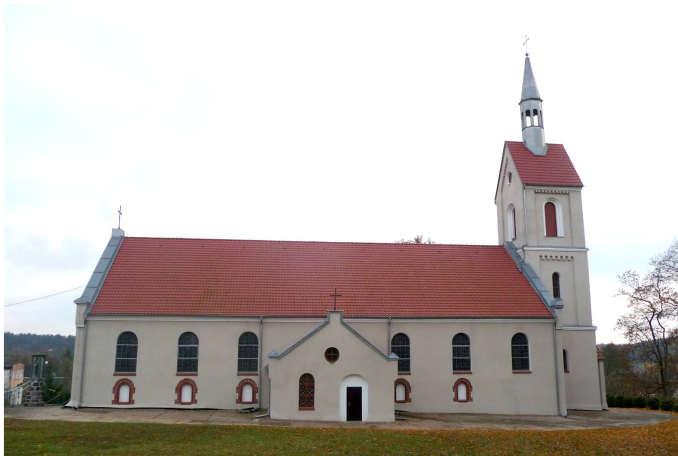
Zdjęcie nr 3. Kościół parafialny pw. Narodzenia NMP, Kumielsk

W Kumielsku był katolicki kościół parafialny na pocz. XVI w., należący do dekanatu reszelskiego. W czasie reformacji zostało wprowadzone wyznanie ewangelickie. Pierwotny