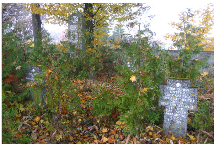
Zdjęcie nr 9. Kwatera wojenna z I wojny światowej przy kościele, Drygaly