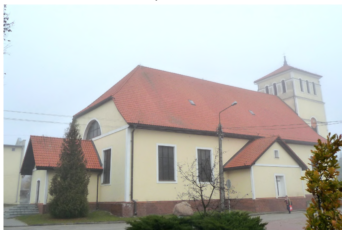
Zdjęcie nr 1. Kościół parafialny pw. św. Andrzeja Baboli z wieżą, ul. Plac Mickiewicza 22, Biała Piska

Kościół ewangelicki pw. Matki Boskiej i św. Józefa, ob. parafialny pw. św. Andrzeja Baboli z wieżą, wyposażeniem wnętrza szczególnie płytą nagrobną Bernarda Drygalskiego, ul. Plac Mickiewicza 22, Biała Piska