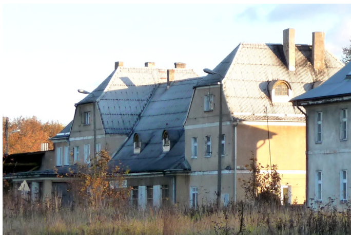
Zdjęcie nr 12. Zespół stacji kolejowej, ul. Kolejowa, Biała Piska

Z tej grupy obiektów zachowały się zabytki kolejnictwa (torowiska i zespoły dworców), drogownictwa (drogi w zdecydowanej większości są o proveniencji późnośredniowiecznej). Zespoły dworców znajdują się w miejscowościach - Biała Piska, Drygały, Kaliszki, Pogorzelska Wielka. Są to zespoły obiektów, głównie obecnie pełniących funkcję mieszkalną, których stan zachowania jest niezadawalający.