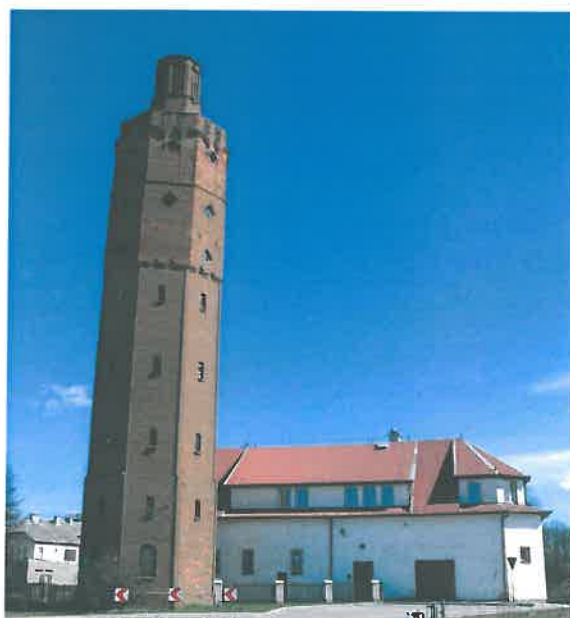
Jednym z najważniejszych zabytków architektury i budownictwa Białej Piskiej jest wodociągowa wieża ciśnienia, której wysokość sięga 34 metrów a za rok budowy uważa się datę 1928 r. W najbliższych latach planowane jest uruchomienie tarasu widokowego na budynku wieży, który byłby jedną z wielu atrakcji miasta.