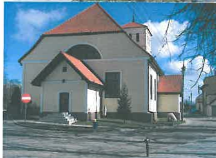
Do najczęściej odwiedzanych zabytków miasta należy kościół barokowy św. Andrzeja Boboli z połowy XVIII w. Zbudowany w latach (1756 - 1763) trójnawowy, z wieżą frontową (1832) arch. Karola Fryderyka Schinkla. Budynek kościoła został w ostatnich latach w znacznym zakresie odnowiony.